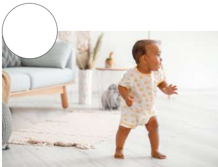
APRENDER A CAMINAR