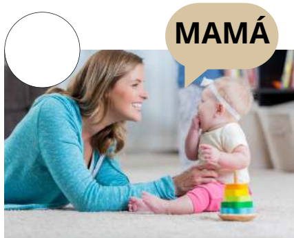
APRENDER A HABLAR

2. Ordena las etapas de la infancia del 1 al 6.