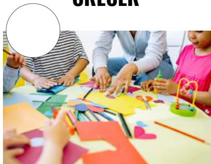
IR AL KINDER