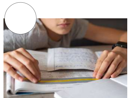
LEER Y ESCRIBIR